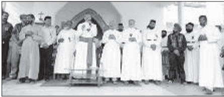
Attack on a Priest and three lay persons